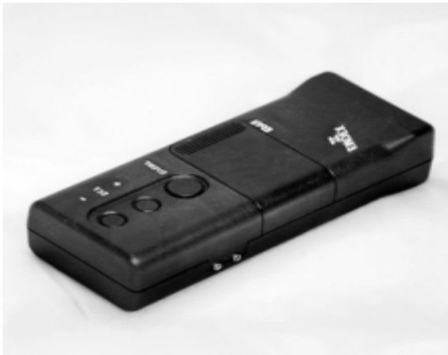
Fig.1 : EMDEX II

L'analyse de données, conjointement qualitative et quantitative, dans une optique de choix optimaux de descripteurs, statistiquement pertinents, et en nombre restreint, est un champ d'étude qui reste ouvert et qui aurait des applications qui dépassent largement le cadre de cette étude.